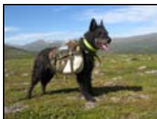
Roughrags Faust är inte "bara" snygg!

( har inga fler uppgifter om långhåren då det inte finns några resultat hos SKK än)