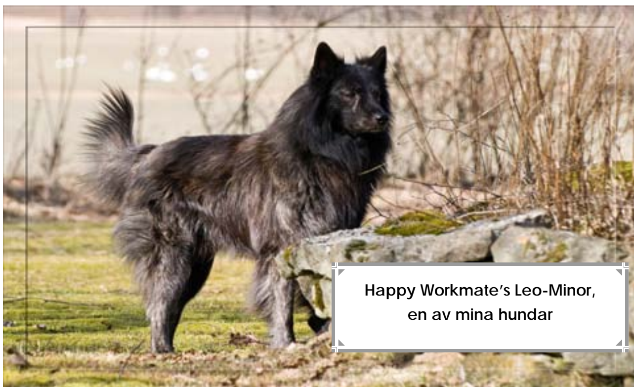
Happy Workmate's Leo-Minor, en av mina hundar